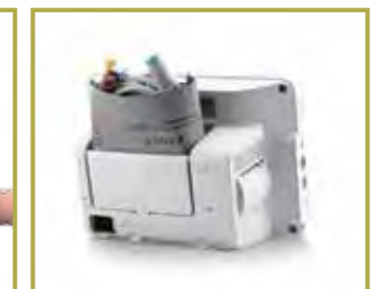
Gabinete exclusivo para accesorios