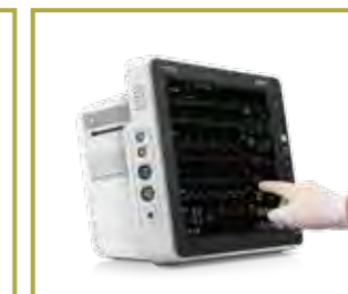
Interfaces fáciles de usar