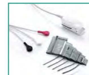
Accesorios de alta calidad