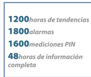
Enorme capacidad de datos