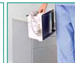
Protección contra caídas